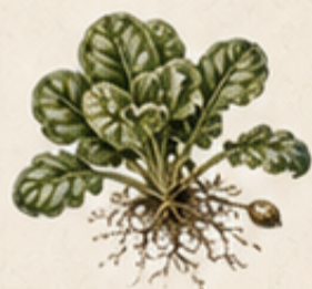
B. VELDSL A Valerianella locusta Zachte salade die goed tegen kou kan.