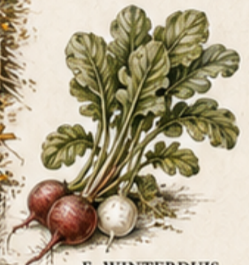
F. WINTERDUJS Raphanus sativus Pittig en knapperig, ideaal voor de herfstkeuken.