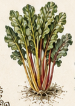
C. SNIJBIET Beta vulgaris var. cicla