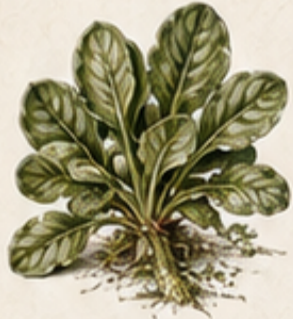
B. VELDSL Valerianella locusta Wintergroen en voedzaam, bestand tegen kou.