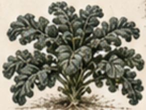
C. BOERENKOOL Brassica oleracea var. acephala De vorst maakt de smaak voller en zachter.