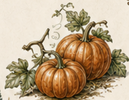
D. POMPOEN Cucurbita maxima Rijpt in de nazomer, bewaart uitstekend voor de winter.