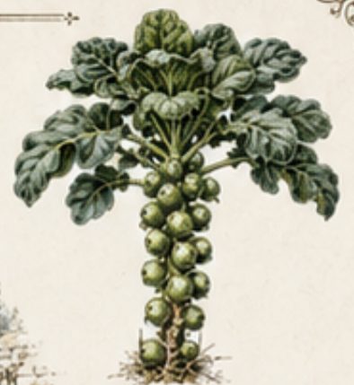
D. SPRUITKOOL Brassica oleracea var. gemmifera Oogst van onder naar boven. Winterbeter van koude nachten.