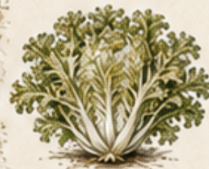
E. ANDIJVIE Cichorium endivia Een stevige salade voor frisse dagen.