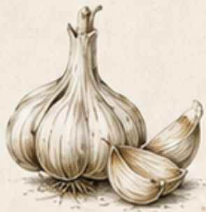
A. KNOFLOOK Allium sativum Plant nu voor een rijke zomerogst.