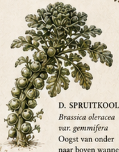
D. SPRUITKOOL Brassica oleracea var. gemmifera Oogst van onder naar boven wanneer de roosjes stevig zijn.