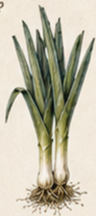
A. PREI Allium porrum Sterk en winterhard. Onmisbaar in de Franse keuken.