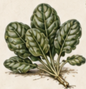
C. SPINAZIE Spinacia oleracea Winst in smaak, na de zomer, ideaal voor de herfst.