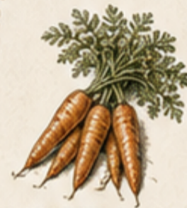
F. WORTEL Daucus carota Late rassen zijn zoet en bewaren goed in de kelder.