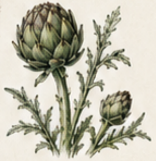
E. ARTISJOK Cynara scolymus In milde streken blijft de plant buiten groen. Beschermen bij tegen strenge vorst.