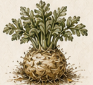
E. KNOLSELDERIJ Apium graveolens var. rapaceum Bewaar op een koele, vorstvrije plaats.