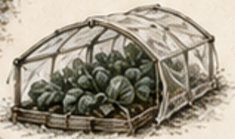
F. BESCHERMD Vliesdoek en kaspjes beschermen jonge gewassen tegen vorst.