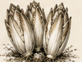
E. WITLOF Cichorium intybus var. foliosum In het donker getrokken voor blanke kroppen.