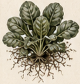
B. VELDSLIA Valerianella locusta Kan tegen kou en smaakt heerlijk nootachtig.