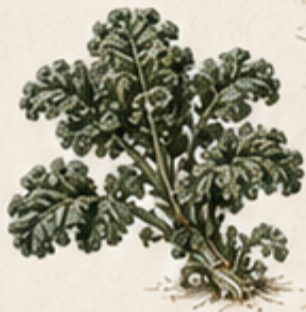
C. BOERENKOOL Brassica oleracea var. sabellica Sterk en zoeter na de eerste nachtvorst.