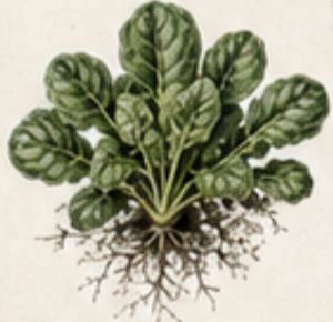
B. VELDSL A Valerianella locusta Wintergroen en zeer vorstbestendig. Ideaal voor de winteroogst.