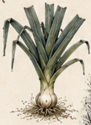
A. WINTERPREI Allium porrum Winterhard en onmisbaar in de winterkeuken.