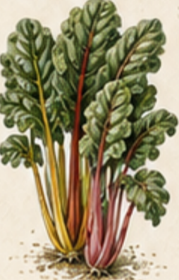
C. SNIJBIET Beta vulgaris var. cicla