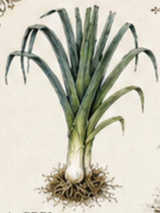
A. PREI Allium porrum Winterhard. Blijf oogsten naar behoefte.