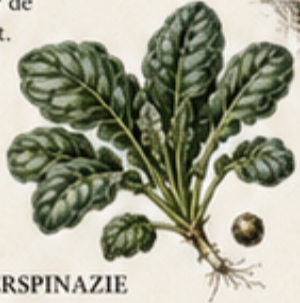
C. WINTERSPINAZIE Spinacia oleracea Zaai in de herfst voor oogst in de winter en vroege lente.