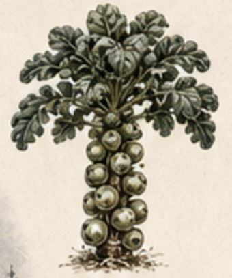
D. SPRUITKOOL Brassica oleracea var. gemmifera Wordt lekkerder na de eerste nachtvorst.